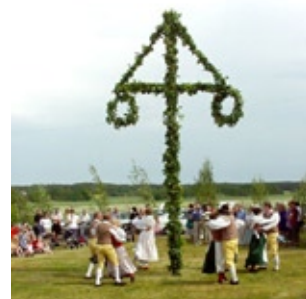
Dans kring midsommarstången