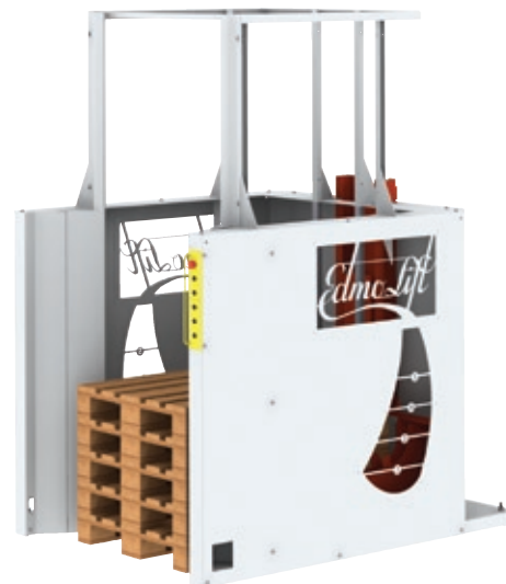
Pallmagasin PM 15-5

Under hösten kommer vi att lansera TLT 1500, en ny vertikal trippelsax.