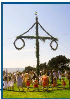
Dans runt midsommarstången