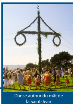
Danse autour du mât de la Saint-Jean