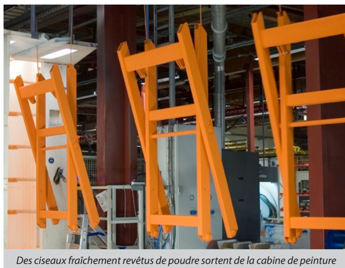
Des ciseaux fraîchement revêtus de poudre sortent de la cabine de peinture

Il y a des économies à faire ; n'hésitez pas à nous consulter avant de choisir la galvanisation !